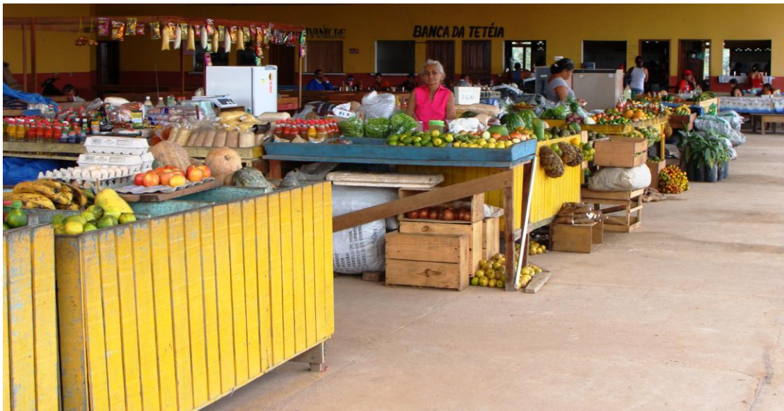
Figura 01 – Feira do produtor de Novo progresso.

Este tipo de canal de venda agrega pouco valor aos produtos Mekrãgnoti e muitas das vezes pagam um valor abaixo do custo da produção. As feiras não são organizadas e a relação com o consumidor final é eventual, uma vez que na cidade o consumidor com faixa de renda melhor prefere realizar as compras nos supermercados locais.