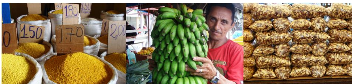
Figura 02 – Feira do produtor de (1) Itaituba, (2) Santarém e (3) Belém (ver o peso)

No levantamento realizado nos territórios da BR 163, entre Novo Progresso/PA e Santarém/PA, só foram identificadas feiras fixas de produtores locais. Nesta região não acontecem feiras com maior representatividade para o incremento de vendas de produtos. Os fatores como distância, dificuldade logística, nível de renda e outros justificam esta ausência, o que infelizmente torna a região como grande fornecedora de matéria prima para agroindústrias vindas de fora.